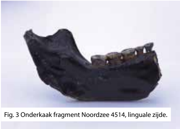
Fig. 3 Onderkaak fragment Noordzee 4514, linguale zijde.