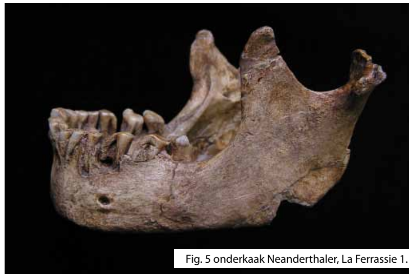
Fig. 5 onderkaak Neanderthaler, La Ferrassie 1.

Aiello, L., C. Dean (1990): An introduction to human evolutionary anatomy . Academic Press Limited, London. Armelagos, G.J., D.P. van Gerven, D.L. Martin, R. Huss-Ashmore (1984): Effects of nutritional change on the skeletal biology