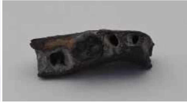
Fig. 2 Onderkaak fragment Hoek van Holland, occlusale zijde.