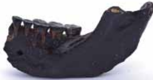
Fig. 4 Onderkaak fragment Noordzee 4514, buccale zijde.

globaal tussen de 2 en 4 cm. en de 1 en 2 cm. (Storm, 1995; tabel 2; fig. 6). De absoluut gemeten maten van de onderkaak uit de Noordzee (4514) vallen binnen die van gemeten onderkaken afkomstig van Koningsveld, desalniettemin is corpus mandibulae opvallend hoog, net als die van de twee Neanderthalers, La Ferrassi 1 en La Quina 5. De onderkaak uit de Noordzee is niet dik en daardoor verhoudingsgewijs aan de smalle kant, met een index van 43.5 (tabel 2).