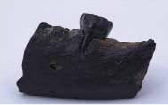
Fig. 1 Onderkaak fragment Hoek van Holland, buccale zijde.